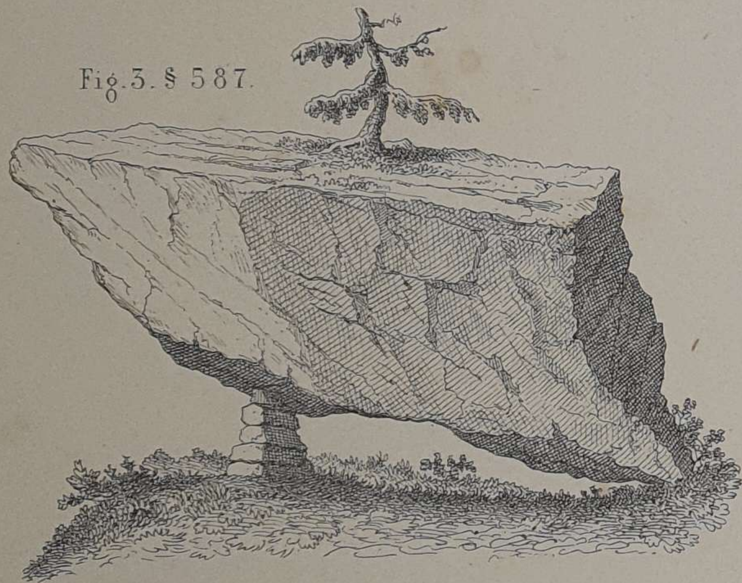
Fig. 3. § 587.