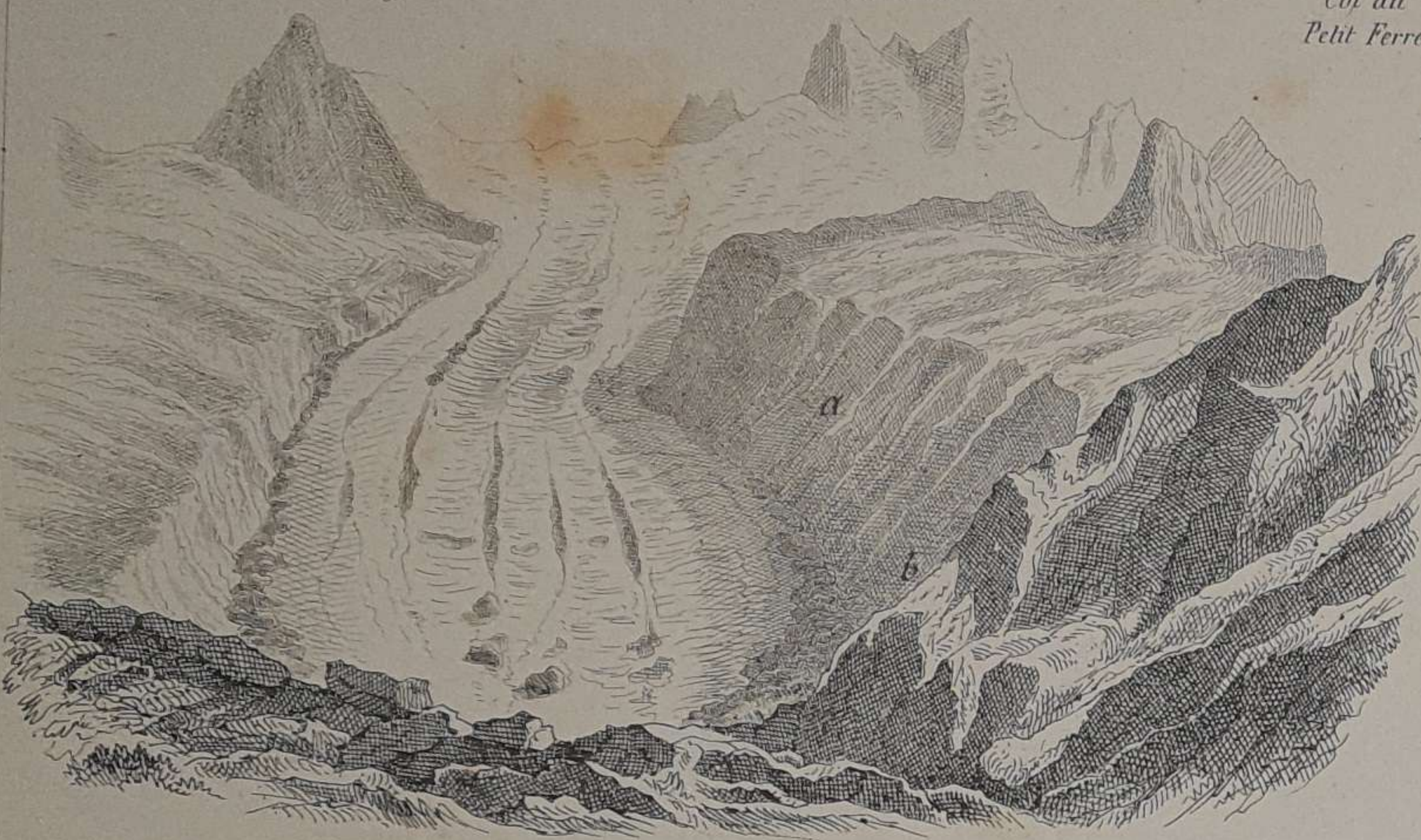
Fig. 1. § 579. Glacier du Mont Dolent ou de Pré de Bar. M. Rouge ou Ru. M. Dolent. Col du Petit Ferret.